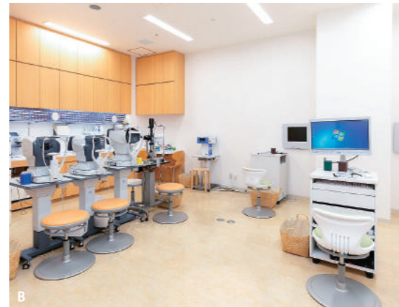
A 院内はベビーカーや車いすでも安心の広々とした空間。リラックスして過ごせるよう、待合室は木目調で白を基調とした明るい雰囲気です B ささまざまな最新の検査機器を積極的に導入し、検査の正確さと迅速性の向上に努めています