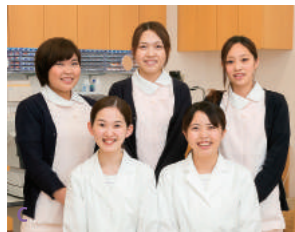
C 院長をはじめ視能訓練士やスタッフのみなさんはすべての患者さんに、丁寧でわかりやすい説明を心掛けています

奈良県立医科大学卒業。大阪大学医学部眼科入局。大阪労災病院、三木山陽病院、小川眼科を経て2014年にさこう眼科を開院。日本眼科学会認定眼科専門医。